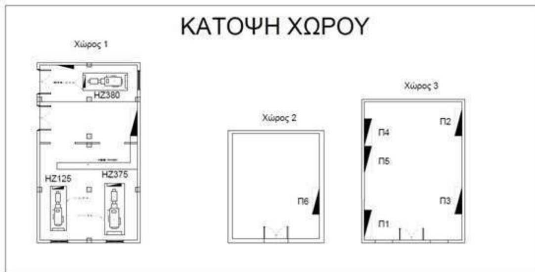
Εικόνα 1 Υφιστάμενη κατάσταση